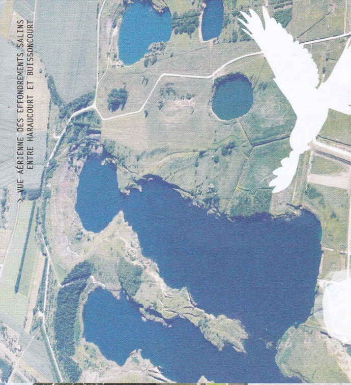
> RUE AÉRIENNE DES EFFONDEMENTS SALINS ENTRE HARAUCOURT ET BUISSONCOURT

Et surtout, vous découvrirez la Lorraine sous un angle méconnu : une terre productrice de sel depuis près de 3000 ans et une région qui possède la dernière mine de sel encore en activité et les deux seules soudières de France.