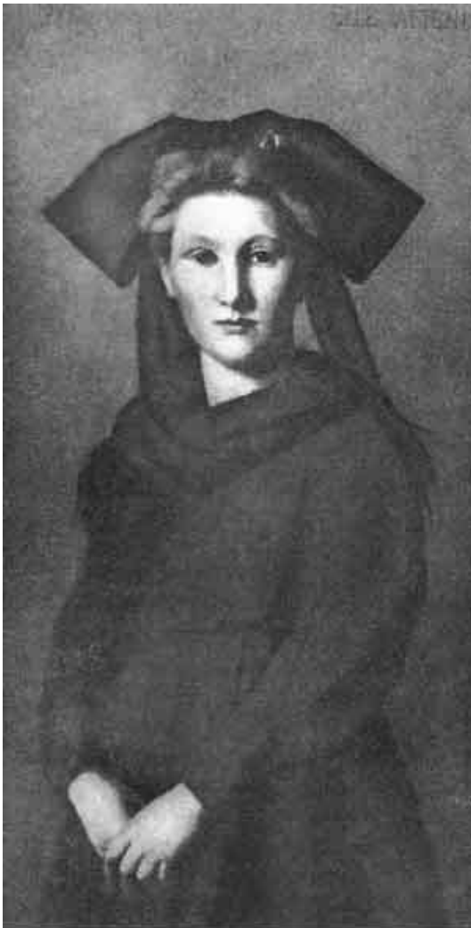
Tableau intitulé « Elle attend » de J-J Henner, 1871 symbolisant l'Alsace endeuillée par l'annexion

Alger et Oran principalement. Ils se disperseront ensuite sur le territoire, au gré du travail trouvé et des mariages contractés avec d'autres immigrés d'origine diverses.